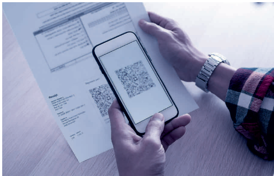
Scannen und fertig: Der QR-Code enthält alle relevanten Rechnungsdaten.

Lesen Sie mehr zum Thema im Blogbeitrag von TREUHAND|SUISSE unter www.treuhandswiss.ch/blog